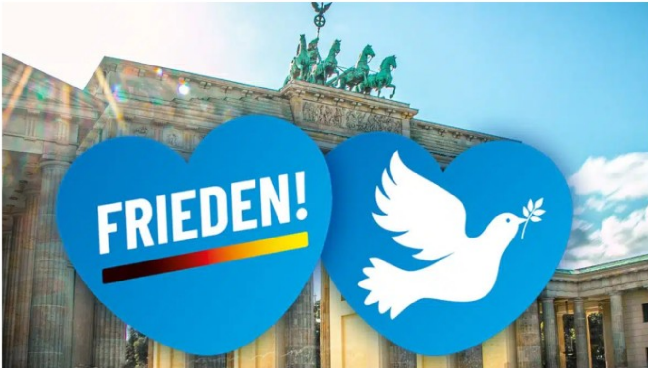
AfD demonstriert für den Frieden